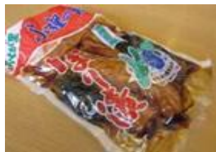
たまり漬け(袋) 540円より