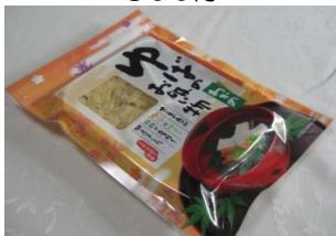
ゆばのお吸い物 540円