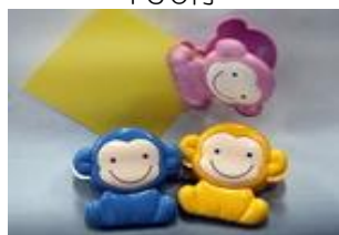
猿マグネットクリップ 390円