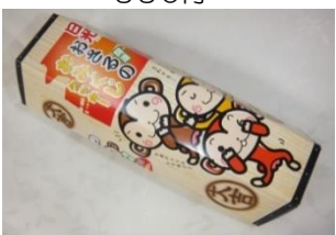
日光おさる野おみくじクッキー(14個) 540円