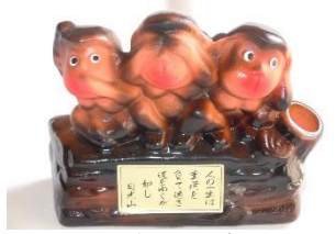
三猿のペン立て 550円