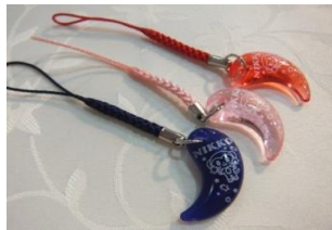
勾玉ストラップ 180円