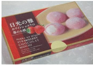
日光の雅ストロベリー いちごショコラ餅(15入) 650円