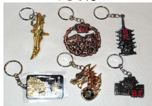
キーホルダー各種 420円より