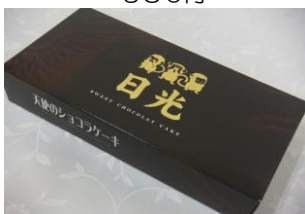
天使のショコラケーキ(10切) 440円