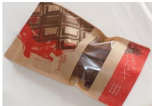
チョコレートビスコッティ 440円