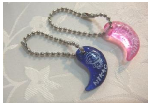
勾玉ボールチェーン 180円