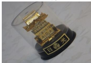
丸筒ケース陽明門 270円