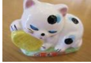
眠り猫置物 360円より