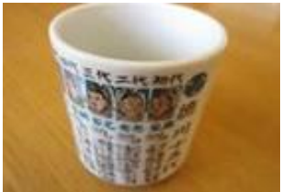
徳川十五代湯呑み 770円