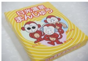
日光温泉まんじゅう(9個) 600円