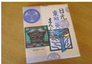
日光東照葵まんじゅう(12個) 700円