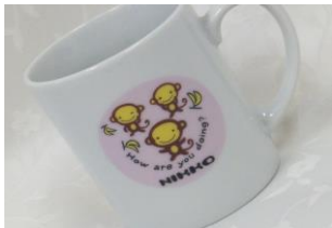
三猿マグカップ 600円