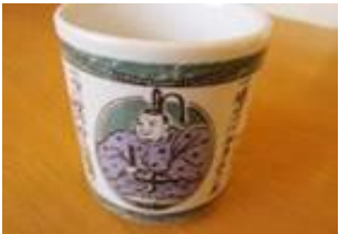
徳川十訓湯呑み 770円