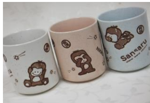
三猿カラー湯呑み 550円