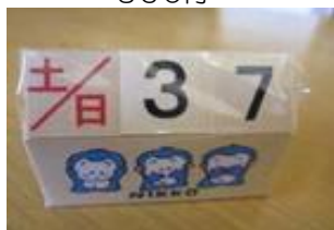
サイコロカレンダー 340円