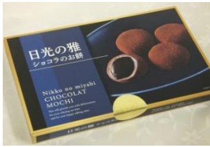
日光の雅ショコラ餅(15入) 650円