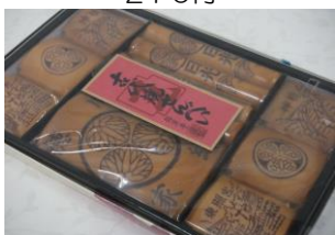
古代焼きせんべい(18枚入) 650円