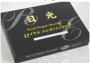
日光ロイヤルショコラ(8個) 330円