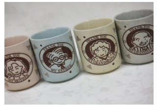
ファミリー湯呑み 550円