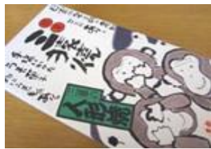
三猿焼 (10個) 650円