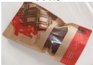
チョコレートビスコッティ 440円