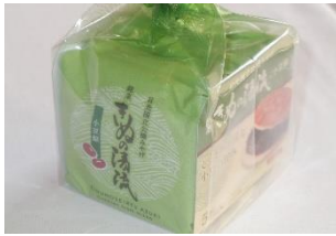
きぬの清流 (5個) 540円