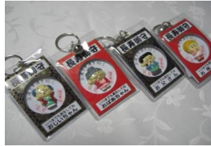
ファミリーお守り 280円より