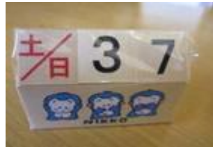
ミニサイコロカレンダー 340円