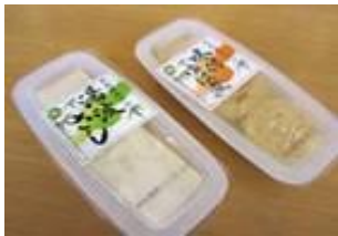
日光湯波 (ゆば) 600円より