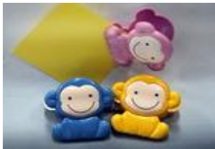
猿マグネットクリップ 420円