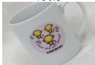
三猿マグカップ 650円