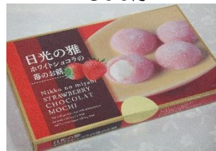
日光の雅 ホワイシショコラの 苺の苺餅 (15入) 650円