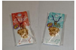
誕生石日光三猿 440円