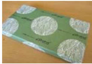
きぬの清流 (8個) 870円