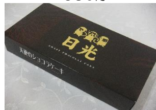
天使のショコラケーキ (10個) 440円