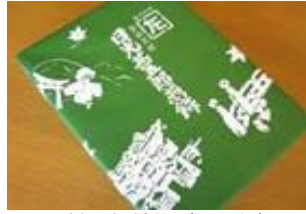
甚五郎煎餅 (16枚) 870円