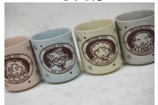
ファミリー湯呑み 600円