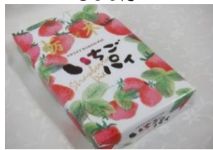
いちごパイ (10個) 380円