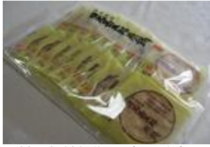
甚五郎煎餅袋入 (18枚) 650円