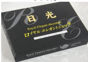
日光ロイヤルショコラ (8個) 330円