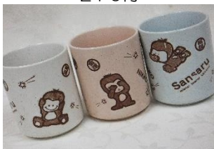
三猿カラー湯呑み 650円