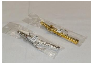
刀キーホルダー 420円