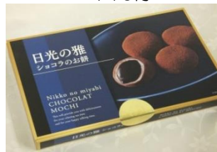
日光の雅 ショコラのお餅 (15入) 650円