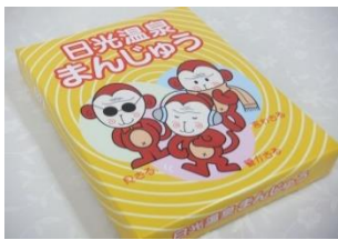
日光温泉まんじゅう (9個) 600円