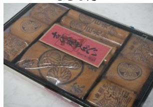
古代焼きせんべい (18枚入) 650円