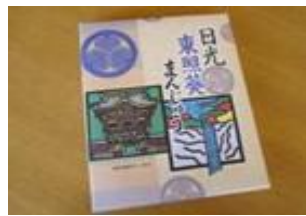
日光東照葵まんじゅう (12個) 700円