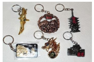
キーホルダー各種 420円