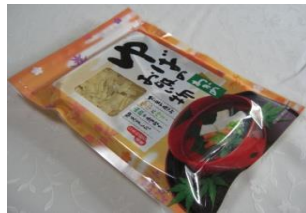
ゆばのお吸い物 650円