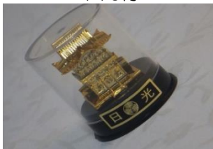
丸筒ケース陽明門 270円