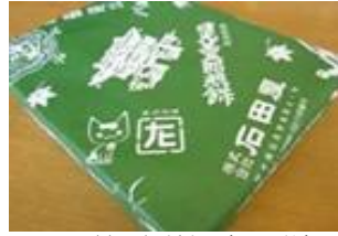
甚五郎煎餅 (27枚) 1300円