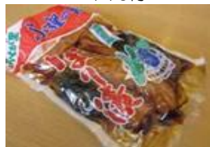
たまり漬け (袋入) 540円より